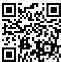
専用申込フォーム

以下の専用お申し込みフォームよりお願いいたします。その際、必要事項をご入力ください。追って、必要書式を送付いたしますので、ご記入の上ご返送をお願いします。令和6年度は、2025年2月28日を応募〆切とします。*令和7年度分は、2025年4月に改めて募集を開始致します。